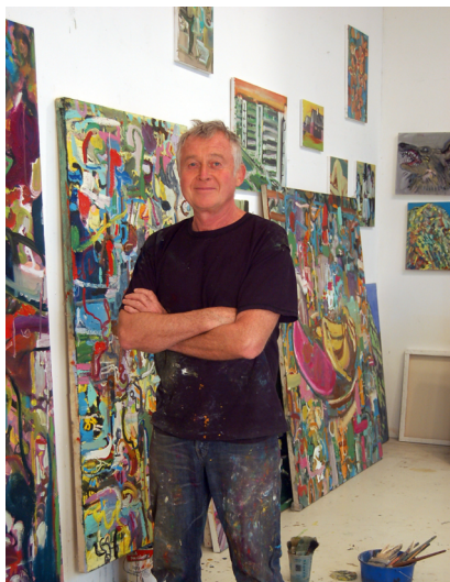
Portrait de Roger Herman