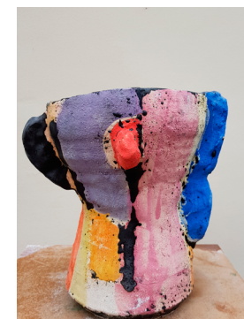
RH#01 - Untitled, 2017 H 30 x D 28 cm