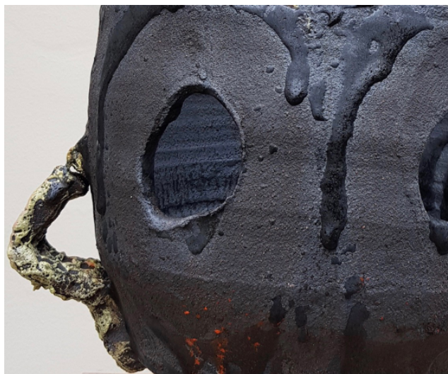
Untitled #03, 2017, glazed stoneware - signed and dated, H 34 x D 44 cm, Courtesy Roger Herman et Galerie Lefebvre & Fils

La Galerie Lefebvre & Fils est heureuse de vous présenter la seconde exposition individuelle de l'artiste allemand Roger Herman, Blumen , du 15 octobre au 18 novembre 2017.