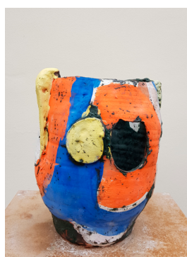
RH#02 - Untitled, 2017 H 30 x D 29 cm Courtesy Roger Herman, Galerie Lefebvre & Fils