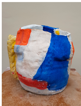
RH#07 - Untitled, 2017 H 25,5 x D 26 cm