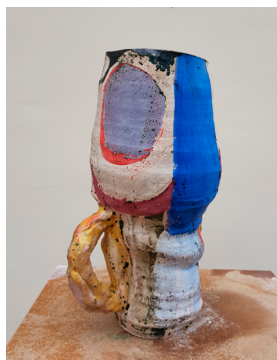
RH#05 - Untitled, 2017 H 35,5 x D 22 cm