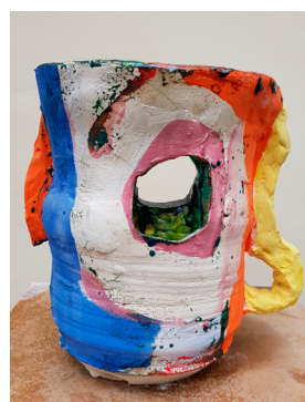
RH#06 - Untitled, 2017 H 29,5 x D 29 cm