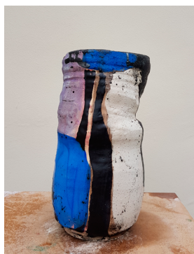
RH#04 - Untitled, 2017 H 28,5 x D 15,5 cm