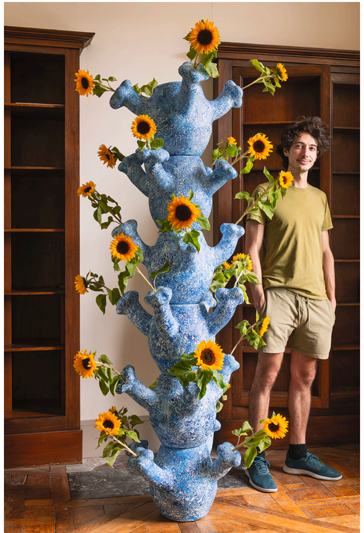
Endless Blue & White Tulipiere, 2023

Craft Forms 202, Wayne Art Center, Wayne, PA