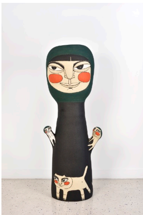
Cat tree, 2020

Chamotte clay, underglaze paint and high firing glaze - Signed 80 x 54 x 55 cm 31.4 x 21.2 x 21.6 in.