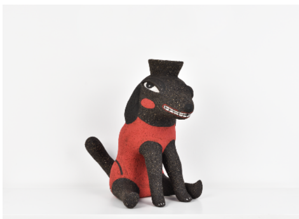
Puppy smiling, 2020

Chamotte clay and underglaze paint - Signed 154 x 54 x 38 cm 60.6 x 21.2 x 14.9 in.