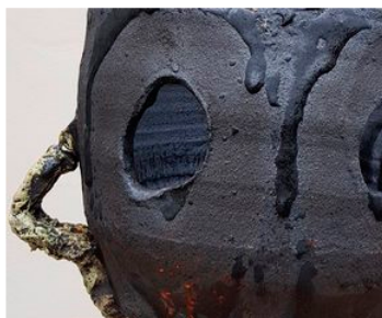
Roger Herman: Untitled #03 , 2017 Glazed Stoneware Signed And Dated H 34 X D 44 Cm © Courtesy Roger Herman et Galerie Lefebvre & Fils